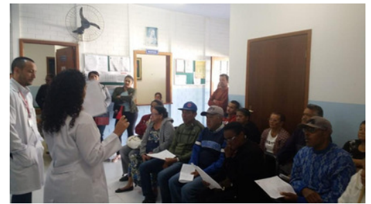
GRUPO DE ORIENTAÇÃO NA UBS DO LAGO AZUL