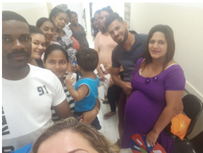
GRUPO DE ORIENTAÇÃO COM GESTANTES