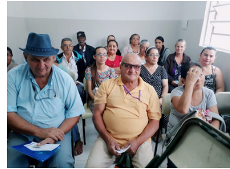
GRUPO DE ORIENTAÇÃO HIPERTENSÃO E DIABETES