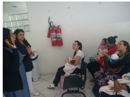
GRUPO DE ORIENTAÇÃO COM FONO