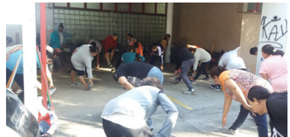
GRUPO DE ORIENTAÇÃO SOBRE PRÁTICAS CORPORAIS