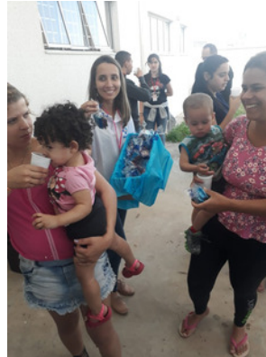
ORIENTAÇÃO SOBRE IST