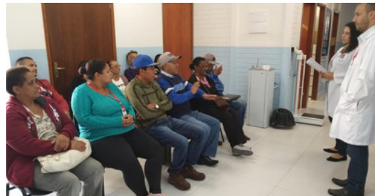
GRUPO DE ORIENTAÇÃO SOBRE ALIMENTAÇÃO SAUDÁVEL