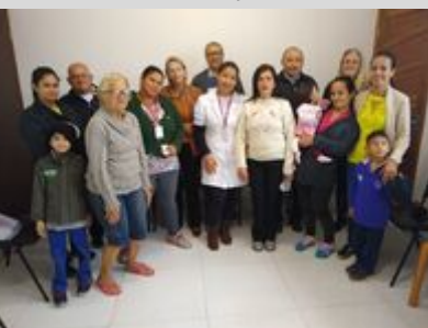
UBS LAGO AZUL 14/08/19