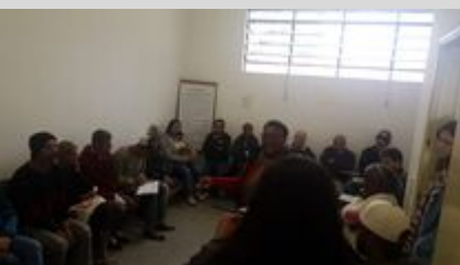
CAPS AD 16/08/19