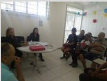
UBS JD. DOS REIS 12/08/19