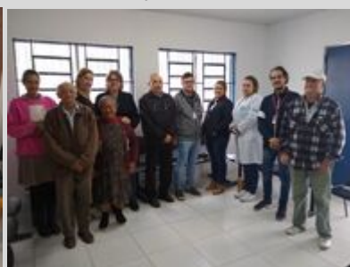
UBS MATO DENTRO 14/08/19