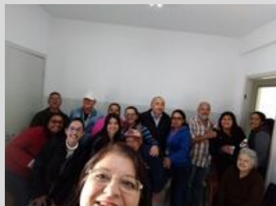
UBS JD. LUCIANA 15/08/19