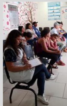
UBS MONTE VERDE 13/08/19