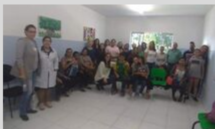
CAPS IJ 26/08/19