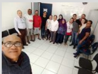
UBS PQ. LANEL 16/08/19