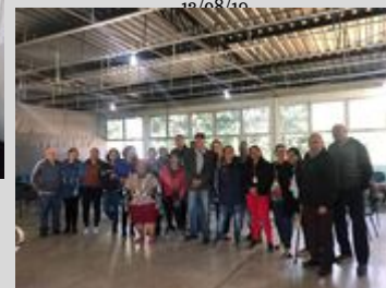
UBS Centro 16/08/19