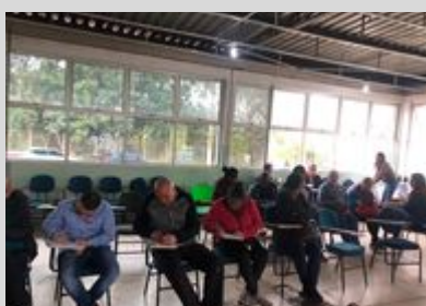
PRAÇA DA SAÚDE 16/08/19