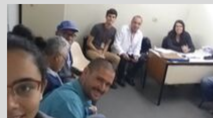
UBS V. ROSALINA 19/08/19