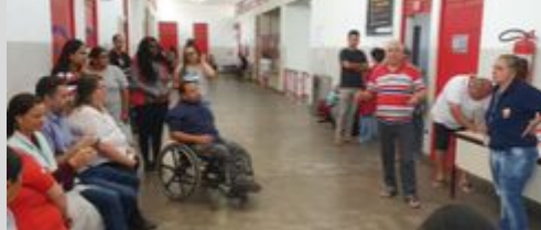
UBS PQ. VITÓRIA 13/08/19