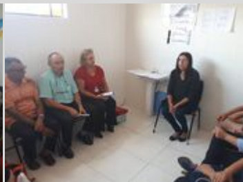
UBS VILA BELA 12/08/19