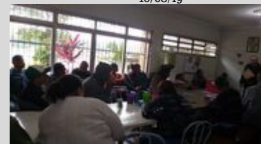
CAPS II 19/08/19