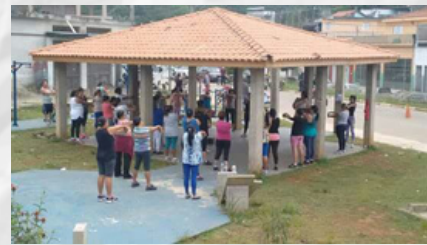
ACADEMIA DE SAÚDE DO PQ. VITÓRIA