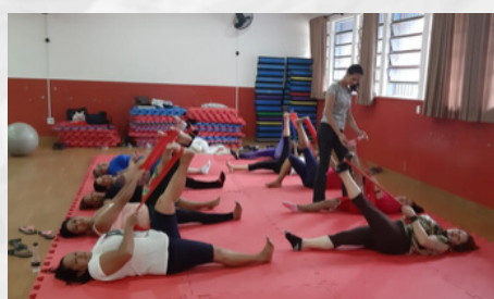
PILATES NO C.S..U.