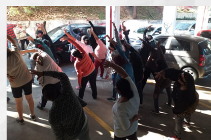
UBS DO PQ. VITÓRIA