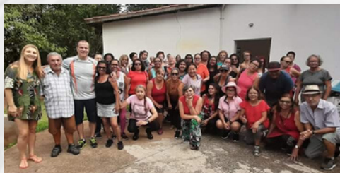
ALUNOS DA ACADEMIA DE SAÚDE DO CENTRO

Neste ano, a secretaria de Saúde apostou alto no bem-estar da população do município. Ofereceu muitas opções de atividade física tais como aulas nas Academias da Saúde, aulas de pilates, aulas de hidroginástica, yoga. Foi um trabalho ousado, realizado em parceria com a Secretaria de Esporte para atender em diferentes pontos da cidade. Contamos também com os espaços do CRAS que foram cedidos pela Secretaria de Assistência Social. A prática de atividade física além de fazer muito bem para o corpo, reduz o risco de hipertensão, doenças cardíacas, acidente vascular cerebral, diabetes, entre outras. Além de fazer bem o corpo, faz bem para a mente, amplia o círculo social reduzindo o risco de depressão e eleva a autoestima.