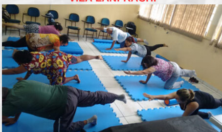
CRAS DO JD. LUCIANA