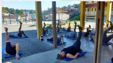
ACADEMIA DE SAÚDE DA VILA LANFRACHI