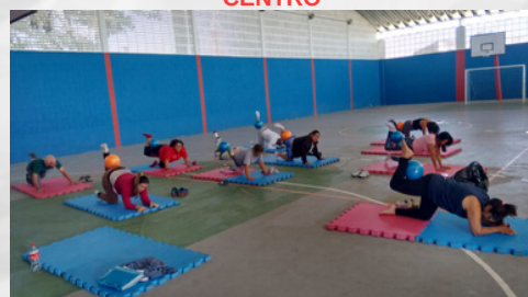
POLO DO GINÁSIO DE ESPORTE NO JD. DOS REIS