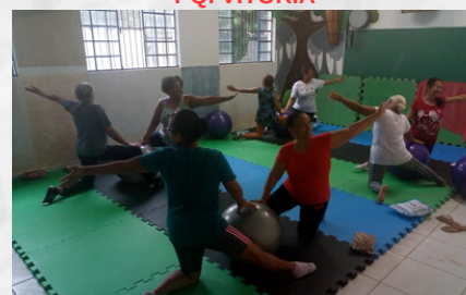
CRAS DO LAGO AZUL